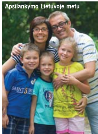
Apsilankymo Lietuvoje metu

Ar mes nesibaiminame, kad vaikai, žinodami apie biologinius tėvus, mažiau mylės mus? Žinoma, ne. Vaikai turi žinoti, kad galima mylėti ir vienus, ir kitus tėvus. Niekas nekaltas, kad taip susiklostė gyvenimas, ir jie negali gyventi kartu su savo biologiniais tėvais. Jeigu bus galimybė užmegzti ryšius